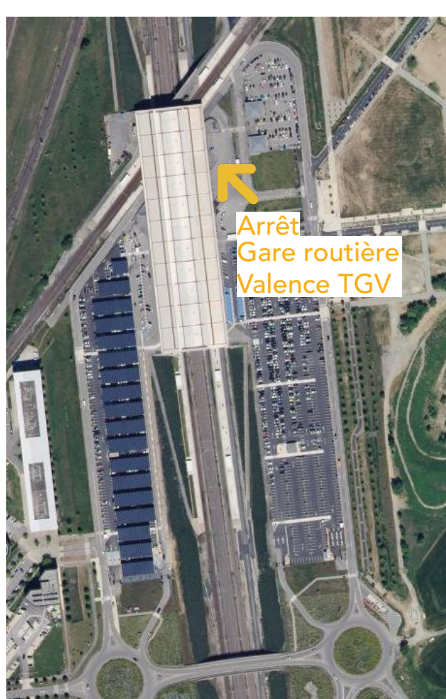
Gare Valence TGV

De 16h30 à 19h30 / 6 navettes aller-retour